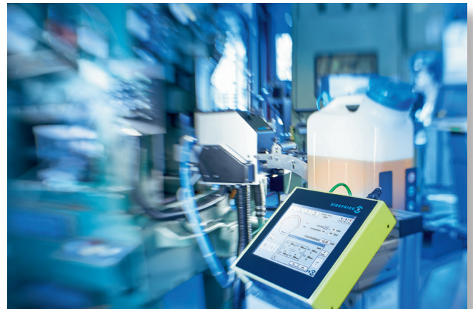
Bild 3: Beölung und elektronischer Walzenvorschub lassen sich über eine gemeinsame Steuerung auf der anwenderfreundlichen Oberfläche bedienen

Wird die Presse im Einrichtbetrieb schrittweise jeweils nur ein paar Winkelgrade bewegt oder wird ein neuer Coil mit der Funktion „Sicheres Vorschieben“ ins Werkzeug eingefahren, besteht bei herkömmlichen Systemen immer die Gefahr, dass zu wenig oder zu viel Schmiermittel auf den Stanzstreifen gelangt. Besonders offensichtlich wird dies bei langen Vorschubwegen. Hier kann es sogar vorkommen, dass an manchen Stellen – bedingt durch die hohe Vorschubgeschwindigkeit – gar kein Schmiermittel auf den Stanzstreifen gelangt. Dieser Umstand kann zu beträchtlichen Schäden am Werkzeug und zu Qualitätseinbußen bei den produzierten Komponenten führen. Die innovative CombiFeed-Technologie ist in der Lage, diese Herausforderungen zu meistern. Durch die interne Übermittlung von Daten zwischen Vorschub- und Beölungssteuerung kann die Einstellung der optimalen Schmiermittelmenge zu jeder Zeit sichergestellt werden.