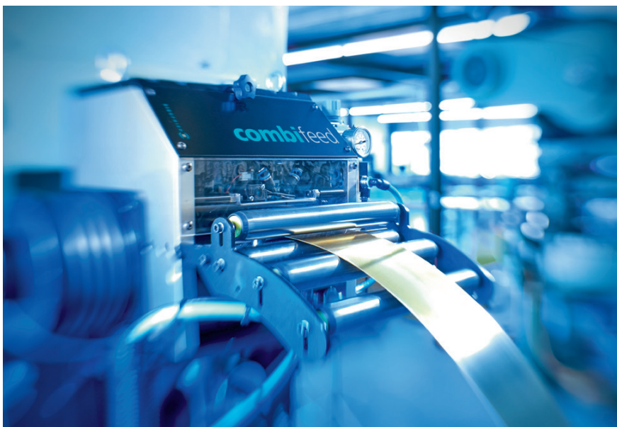
Bild 1: Das neue CombiFeed-System kombiniert bewährte Vorschubtechnik mit einem innovativen Beölungssystem

Das neue CombiFeed-System kann also eine ganze Reihe von Stärken ausspielen. Insbesondere bei langen Vorschubwegen ist eine präzise Beölung eine wirklich anspruchsvolle Aufgabe. Eine besondere Herausforderung ist es auch, in den unterschiedlichen Fertigungssituationen das Schmiermittel stets optimal auf den Stanzstreifen aufzubringen – im Einrichtbetrieb wie im Dauerlauf oder auch bei speziellen Funktionen wie etwa „Sicheres Vorschieben“.